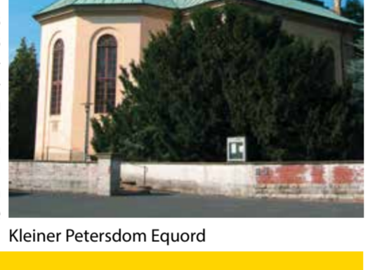
Kleiner Petersdom Equord

In nördlicher Richtung am „Gutshof Rethmar“ vorbei, dann die Bundesstraße B 65 in nördlicher Richtung überqueren. Dem Verlauf der Triftstraße folgend erreichen Sie nach ca. 1.700 m einen Wald (Landschaftsschutzgebiet „Neuloh“). Dem Straßenverlauf weiter folgen Nach ca. 500 m rechts einbiegen in das Landschaftsschutzgebiet „Billerbachwiesen“. Dem Weg 900 m folgen und leicht rechts auf ein Wäldchen zufahren Nach Überqueren einer kleinen Brücke links halten bis zur