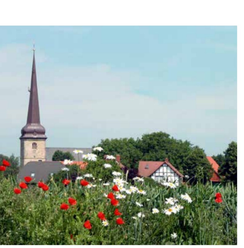
Blück auf Borsum

Auf dem Radweg nach Hohenhameln passieren Sie die ländliche Siedlung Bründeln und durchqueren die Ortschaft Clauen, von wo aus Sie die Route auf eine ehemalige, stillgelegte Eisenbahnstrecke führt.